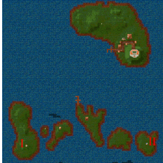
carte du territoire

Des Serpents et autres bestioles, vivant dans l'eau, infestent le coin de même que des aigles. Cette région est remise à zéro tous les 8 mois.