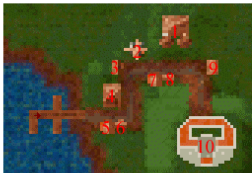
Plan du village